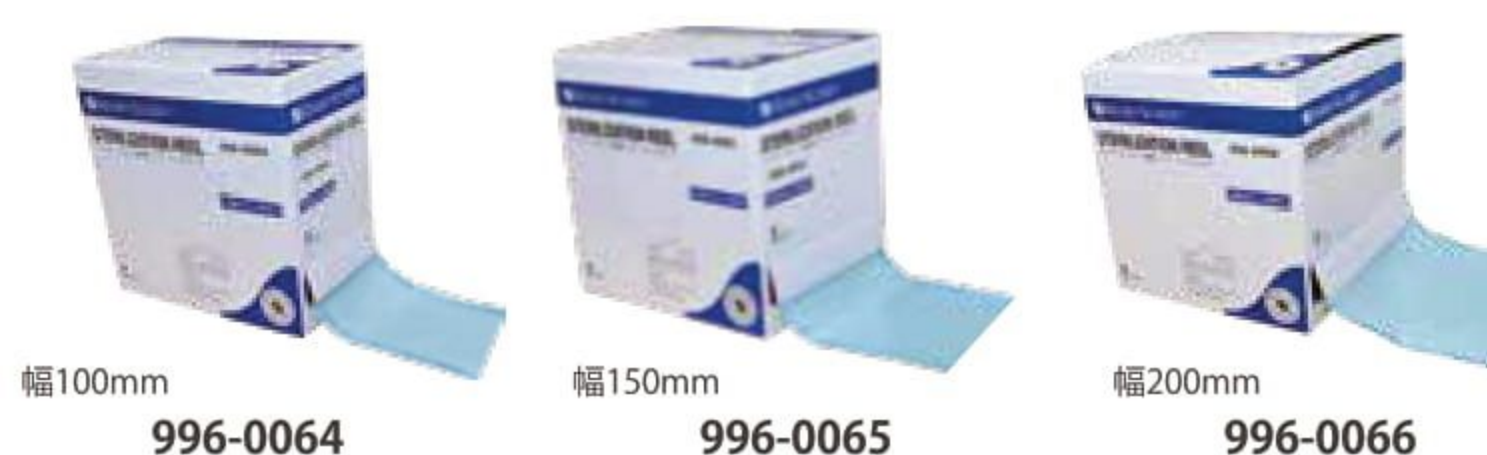
幅100mm 996-0064 幅150mm 996-0065 幅200mm 996-0066