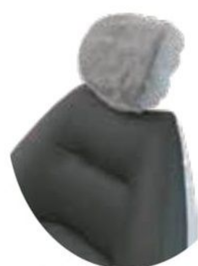
スティックタイプ・ホワイト