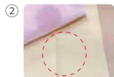
② 裏面防水加工素材が水分をキャッチ！2枚目に染みついていません。