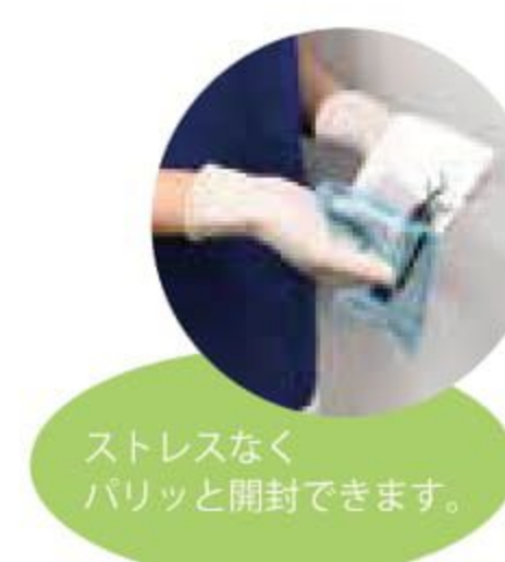
ストレスなく バリッと開封できます。