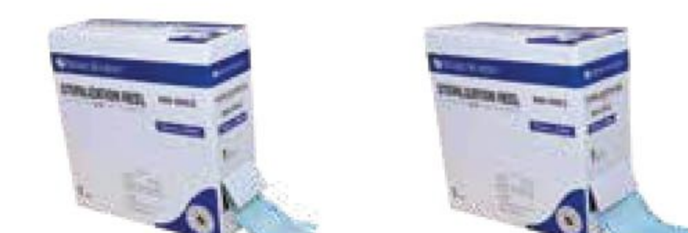
幅55mm 996-0062 幅75mm 996-0063