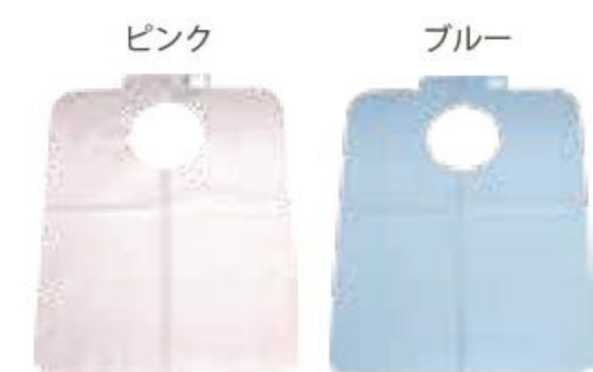
テープ付き 530mm × 425mm