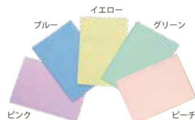
スクエア 330mm × 450mm